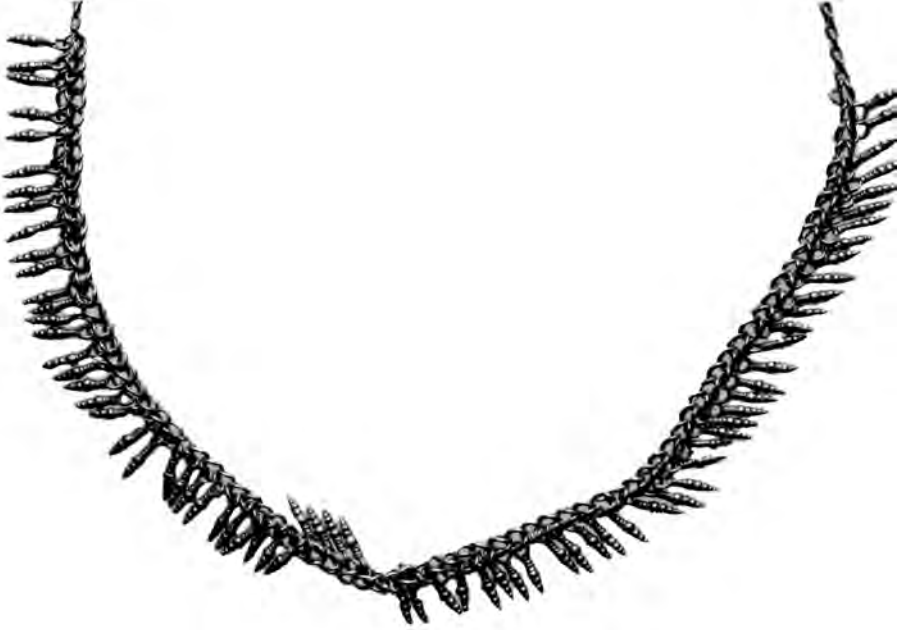
FIGURA 3. — Collar 1.