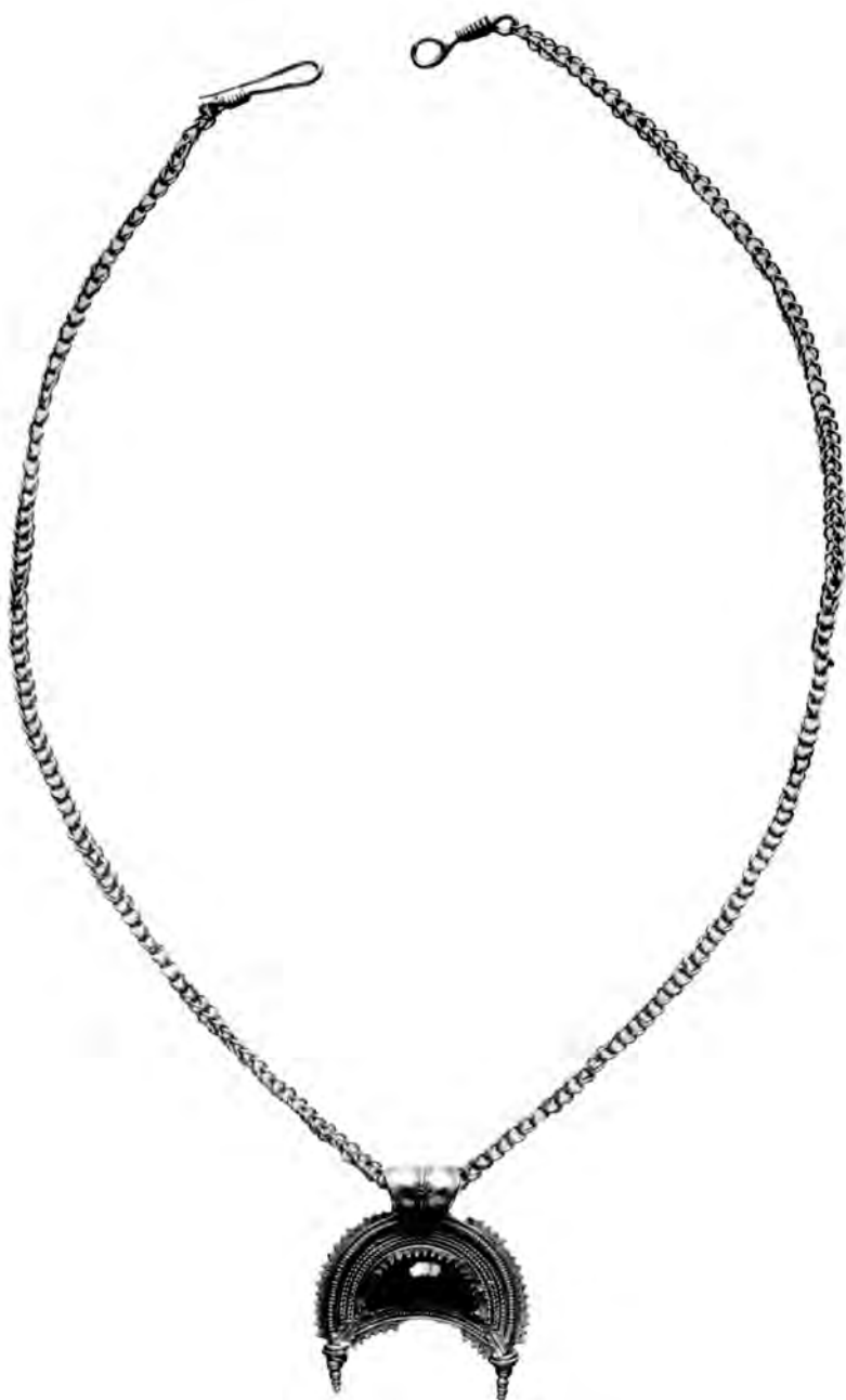
FIGURA 4. — Collar 2.